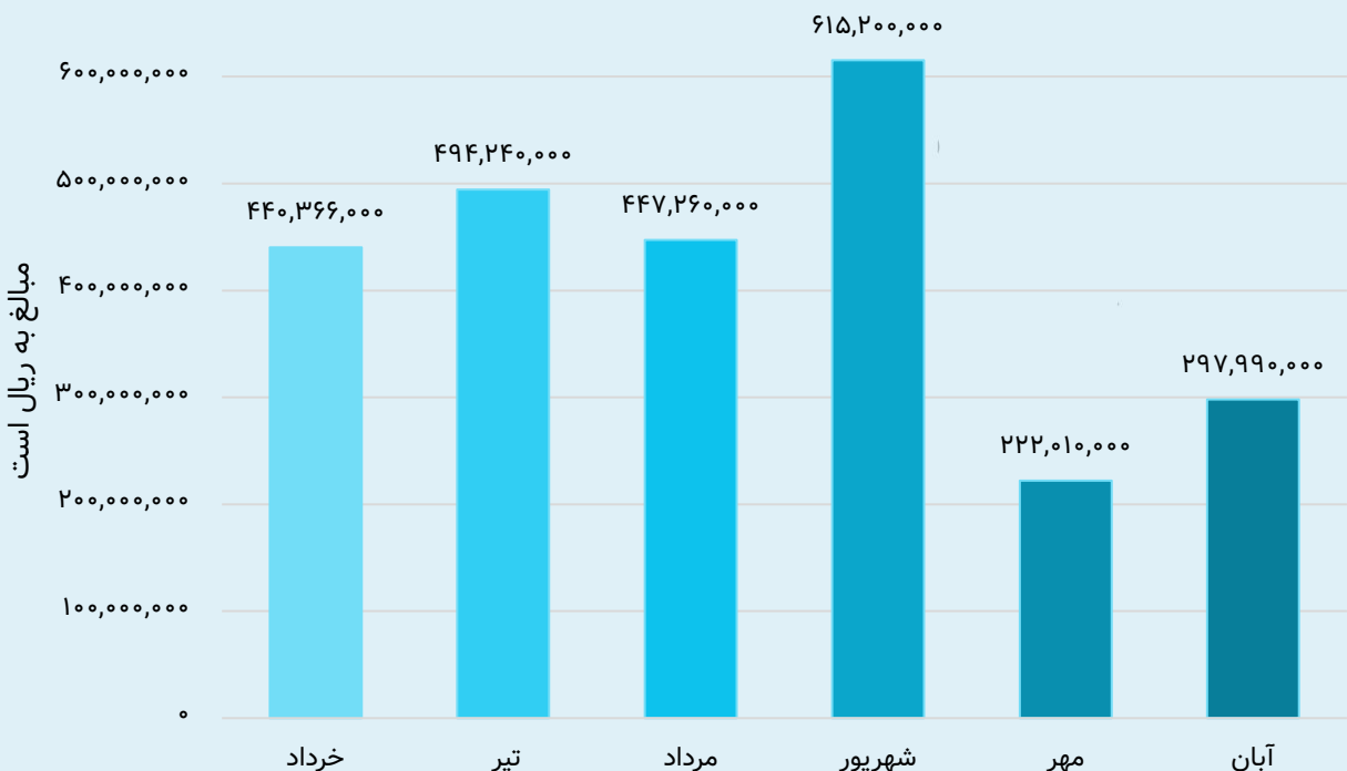
مبالغ جمع‌آوری شده در هر ماه

تجربه‌ی روزهای اول ارفک نشان داده است که کمک‌های کوچک از تعداد همراهان بسیار می‌تواند کارهای بزرگی را به ثمر بنشانند و برای این کار همدلی و اتحاد حرف اول را می‌زند. ما در همدست مهر ، هم‌پیمان شدیم تا با صرف مبالغ خرد، فردای یک کودک در معرض آسیب را روشن کنیم.